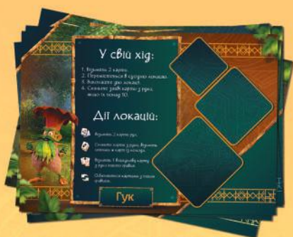
5 планшетів гравців