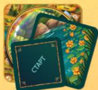
24 жетони цілей

(8 стартових жетонів — маленькі ромби, 8 жетонів другого етапу — середні ромби, 8 жетонів третього етапу — великі ромби)