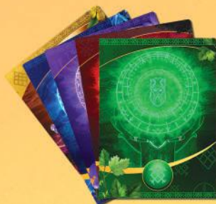
56 карт рун