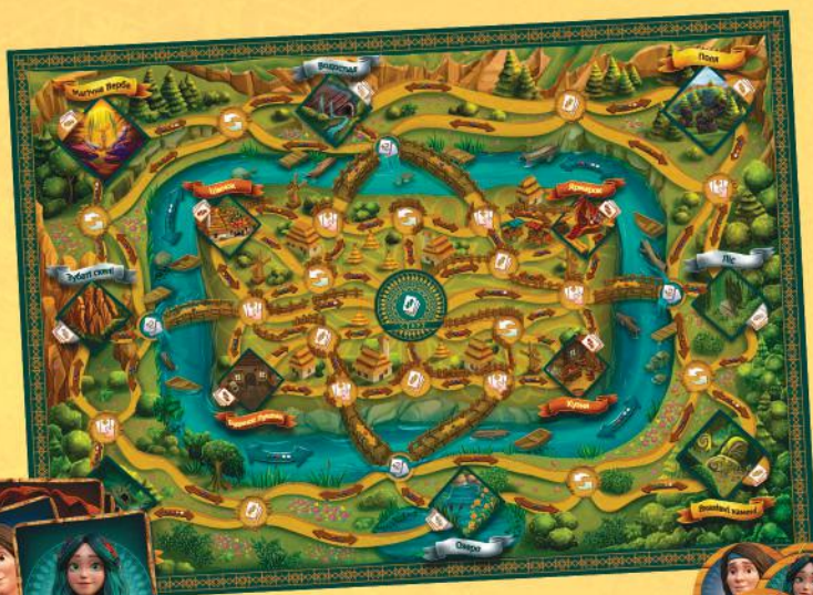
1 ігрове поле