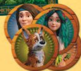
5 жетонів-пам'яток персонажів