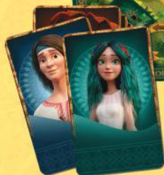
5 фігурок персонажів